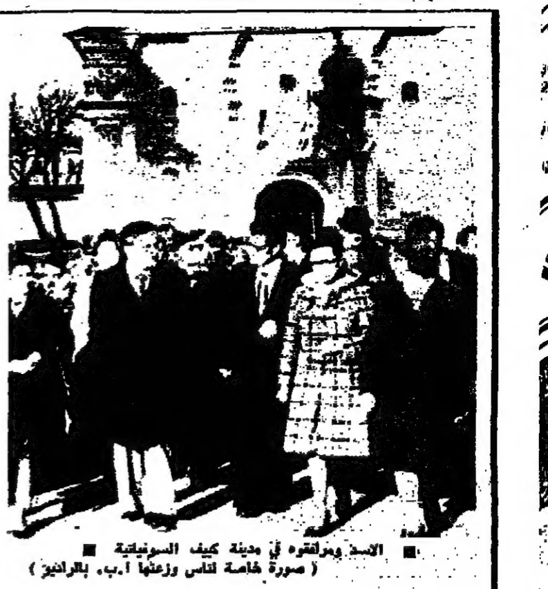
البيان السوري - السوفياتي: جنتيف يشارك الفلسطينيين وأرتياح للوضع في لبنان اعتلت سوريا والاتحاد السوفياتي، من أجل إقامة سلام عادل ودائم في الشرق الأوسط، وحرمها على مفاد مؤتمر السلام في جنيف بالسرعة، وبمشاركة منظمة التحرير الفلسطينية، والعرب، والبنانيين، وفي مقدمتهم، إلى طبيعته في لبنان ولتوسيع علاقاتها، ومماوثهما في شتى المجالات.